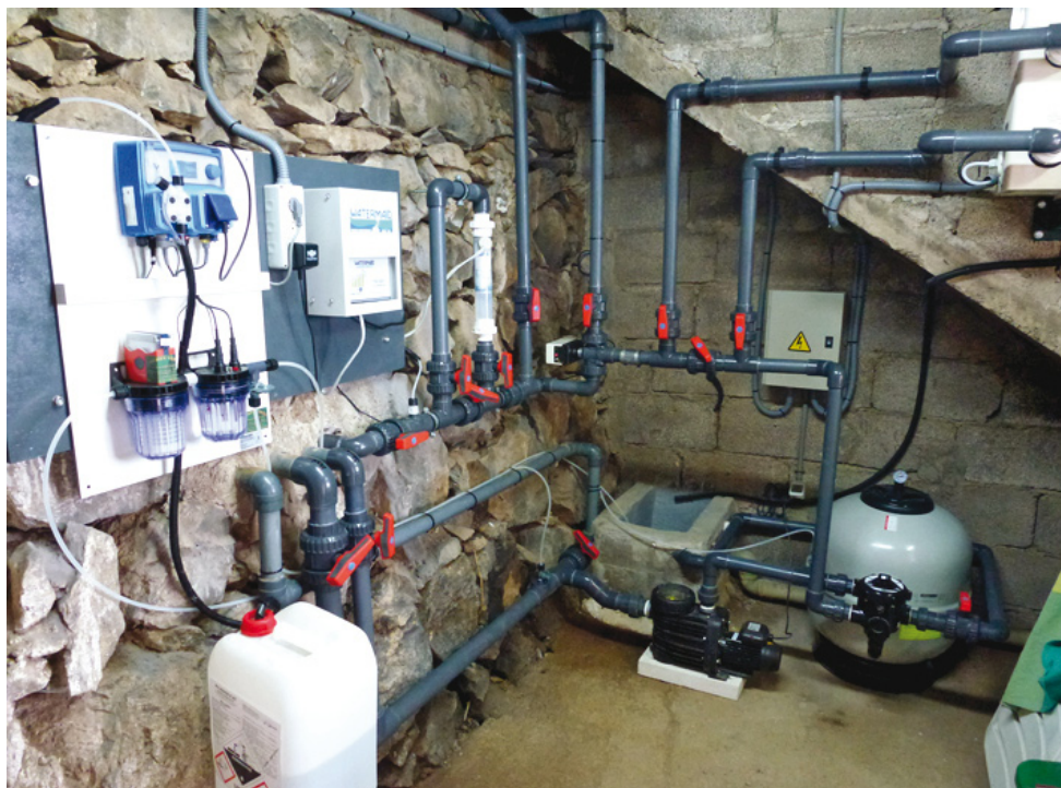
⬆ Vollautomatische Technik für Schwimmbad, Garten und Haus. Von Profis eingebaut, funktioniert das auch.

Das Unternehmen Tenerife Verde hat seinen Sitz zwar im Norden von Teneriffa, arbeitet und berät seine Kunden aber auf der ganzen Insel. Dabei hat sich nach mehr als fünfzehn Jahren ständiger Fortbildung und Wissenserweiterung ein sehr breites Spektrum entwickelt.