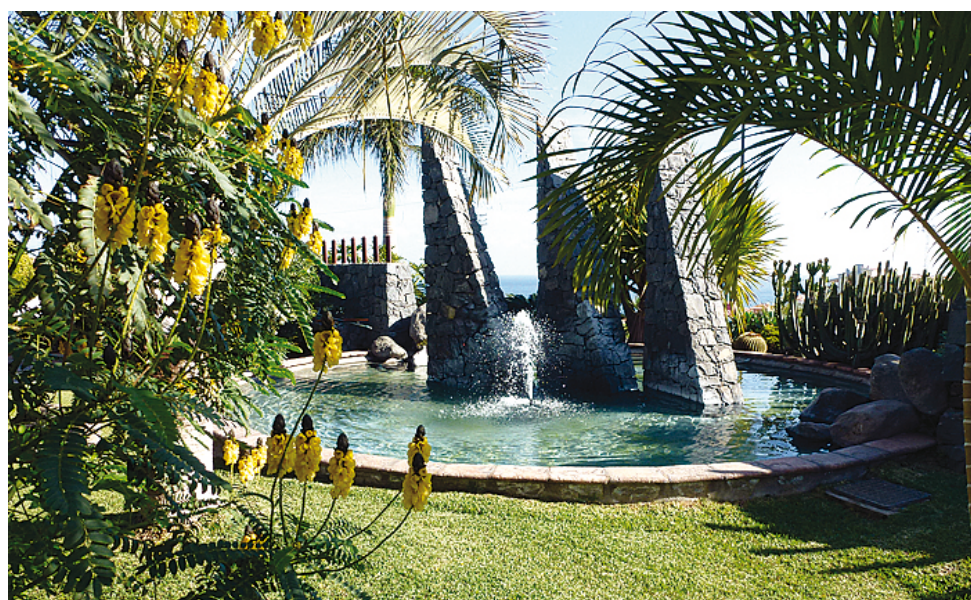
⬆ Von Analyse des Bodens über Bewässerung bis hin zum Schnitt und zur Pflege – alles aus einer Hand.

Bei der Gartengestaltung beginnt dieses schon mit der Analyse des Bodens, damit die optimale Bepflanzung ausgewählt werden kann. Aber auch die richtige Bewässerung, fachgerechter Schnitt und Pflege von Palmen und Bäumen, Schädlings- und Krankheitsbekämpfung bei Befall durch Insekten, Pilze, Bakterien und Viren